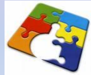
Servizio Studenti con disabilità