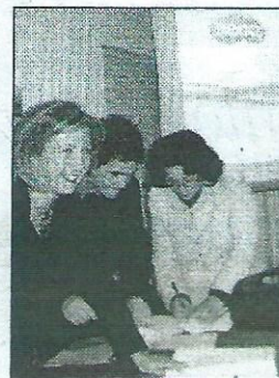
La firma del protocollo

gni quotidiani dei propri iscritti. L'incontro, molto partecipato, ha visto anche momenti di dibattito durante il quale sono scaturite domande e curiosità alle quali ha risposto Liparota. Vari inoltre sono stati gli interventi dei rappresentanti delle associazioni aderenti al pro-