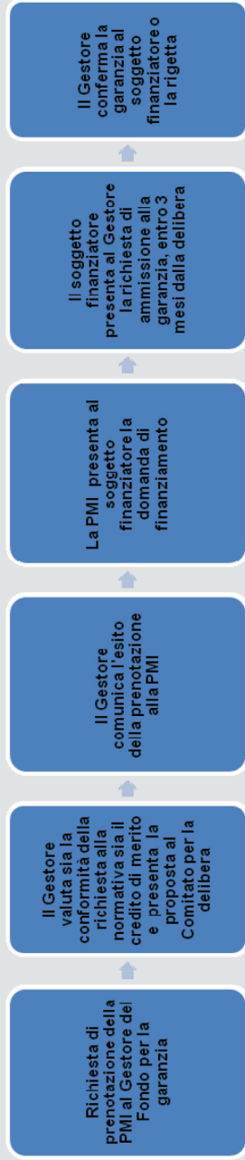
Figura 2. Accesso al Fondo con prenotazione di garanzia alla Riserva PON RC